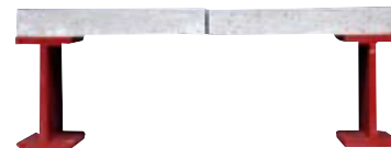
Plancher béton sur ossature métallique