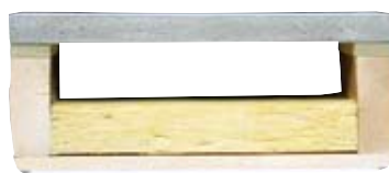
Plancher béton sur ossature bois