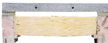
Plancher de rez-de-chaussée