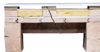
Plancher béton surélevé sur plancher bois